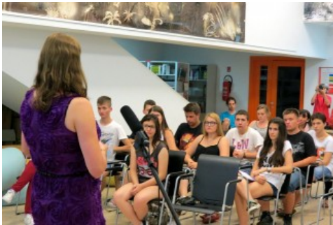
Ljetna škola znanosti