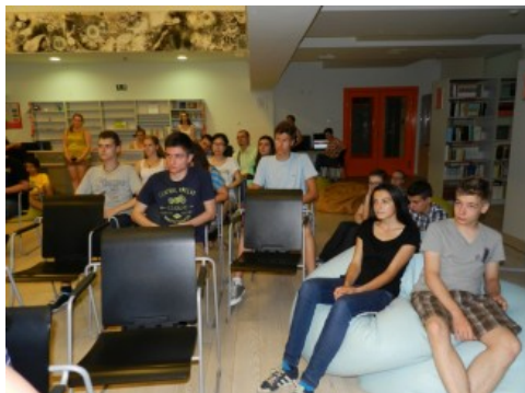
Srednjoškolci na otvorenju Ljetne škole znanosti