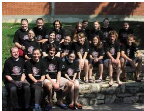
Ljetna škola znanosti - arhivska fotografija