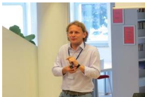
Ivan Đikić na Ljetnoj školi znanosti u Požegi