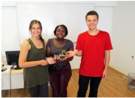
Mladi na Ljetnoj školi znanosti u požeškoj Gimnaziji